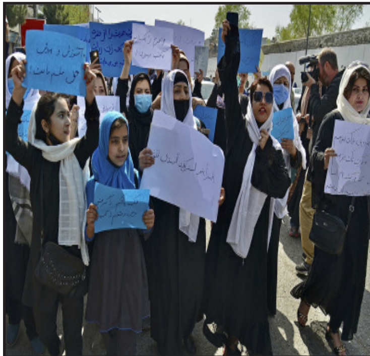
केटीहरूले तालिबानको निर्णयको विरोध गर्दै 'स्कूल खोल, न्याय गर' भन्ने नारा लगाएका थिए। यी युवतीले हातमा प्लाकार्ड लिएका थिए जसमा लेखिएको थियो- 'शिक्षा हाम्रो मौलिक अधिकार हो, यो कुनै राजनीतिक योजना होइन।' यी प्रदर्शनकारी केटीले छोटो दूरीको जुलुस निकाले तर तालिबान लडाकुहरू प्रदर्शनस्थलमा पुगेपछि फर्कन बाध्य भएका थिए। अहिले विद्यालयमा छात्रालाई जान दिने निर्णय कार्यान्वयन नगरेपछि पुनः विश्वभर चिन्ता र चासो व्यक्त भएको छ। विद्यालय जान पाउनु आफूहरूको आधारभूत मानवअधिकार भएकाले यसलाई राजनीतिक रूपमा लिन नहुने प्रदर्शनकारीहरूको भनाइ छ। हामीलाई विद्यालय जान दे, हामीलाई न्याय दे जस्ता माग राख्दै प्रदर्शनकारीले काबुलमा परेको प्रदर्शनलाई निकै महत्त्व दिइएको छ। उनीहरूको आन्दोलनप्रति अधिकारवादी संघ संस्था तथा निकायहरूले पनि ऐक्यबद्धता जनाएका छन्। तालिबान शासन र इस्लामिक धर्मको केन्द्रले बालिकाका लागि विद्यालय किन नखोलेको भनेर कुनै जवाफ दिएनन्। अफगानिस्तानमा माध्यमिक विद्यालयका केटीहरू विगत ७ महिनादेखि विद्यालय गएका छैनन्। शिक्षा सबैको अधिकार भएको उल्लेख गर्दै तालिबानले यो अधिकार खोसेको प्रदर्शनमा सहभागी एक बालिकाले बताइन्। यसै क्रममा अर्की एक आन्दोलनकारी युवतीले तालिबानले अफगानिस्तानका महिलामाथि दमन गरिरहेको बताइन्। गत वर्ष अगस्त १५ मा अमेरिकी सेनाले अफगानिस्तान छोडेपछि दुई दशकपछि तालिबान सत्तामा फर्किएको थियो। त्यसयता तालिबान सरकारले महिलामाथि धेरै प्रतिबन्ध लगाएको छ। महिलाहरूलाई सरकारी जागिरबाट निकालेको थियो, एकलै यात्रा

अफगानिस्तानमा छात्राले विद्यालयमा पढ्न पाउनुपर्ने माग गर्दै शनिवार प्रदर्शन गरेका छन्। अफगानिस्तानको राजधानी काबुलमा छात्राले 'विद्यालय खोल' भन्ने माग गर्दै शनिवार गरेका हुन्। विद्यालयमा पढ्न र पढाउन पाउनु आफूहरूको आधारभूत अधिकार भएकाले विद्यालय जान पाउने व्यवस्था गर्नुपर्ने उनीहरूको माग छ। अगस्त २०२१ मा तालिबानले अफगानिस्तानमा सत्ता कब्जा गरेपछि देशभरका विद्यालयहरू बन्द गरेको थियो। अफगानिस्तानमा तत्कालीन तालिबान विद्रोहीले सत्ता कब्जा गरेपछि महिलाहरूलाई अध्ययन अध्यापन तथा रोजगारीलगायतका कार्यमा सहभागी हुन नपाउने घोषणा गरेको थियो। सरकारको उक्त घोषणाको विश्वभर आलोचना भएको थियो। महिलालाई अध्ययन अध्यापन र रोजगारीमा बञ्चित गर्ने निर्णय सच्याउन दबाव परेको थियो। तालिबानी उच्च अधिकारीले भने त्यति वेलादेखि नै केही समयका लागि मात्रै यस्तो व्यवस्था गरिएको र चाँडै बालिकालाई पनि पढ्न दिइने प्रतिबद्धता जनाउँदै आएका थिए। प्रतिबद्धताअनुसार तालिबान सरकारले गत हप्तादेखि छात्रालाई विद्यालय जान दिने निर्णय गरेको थियो। बुधवार अफगानिस्तानका हजारौं बालिका फेरि पढ्ने आशा लिएर विद्यालय पुगे। शिक्षा मन्त्रालयले यसै दिनदेखि कक्षा सञ्चालन गर्ने निर्णय गरेको थियो। त्यसको केही घण्टापछि तालिबानले केटीका लागि पोशाकको निर्णय नभएकाले विद्यालय नखोल्ने घोषणा गर्‍यो। तालिबान सरकारको यो निर्णयबाट धेरै केटीहरू विद्यालय परिसरमै रोएका थिए। शनिवार काबुलको सिटी स्क्वायर पुगेका