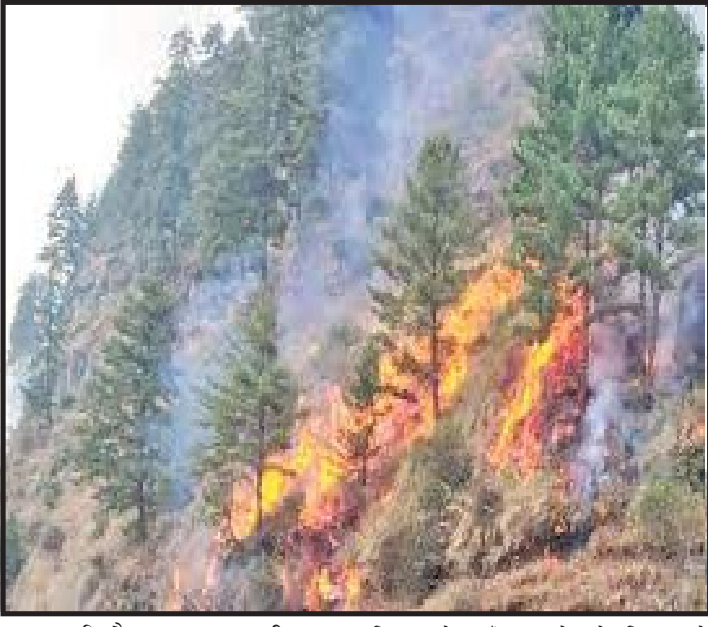
जङ्गल नजिकैका मानव बस्तीहरुमा समेत असर पारेको छ । डढेलोको धुवाँले जंगलको नजिकै रहेका बस्तीका स्थानीयहरुमा आँखा चिलाउने, आँखा रातो हुने, बिहानको समयमा धुवाँले अध्यारो हुने जस्ता समस्या देखिएको छ । बाकी चौटो पृष्ठमा.....

वीरगन्ज, १४ चैत । पर्साको जंगलमा बिगत एक हप्तादेखि लागेको डढेलो अझै नियन्त्रणमा आउन सकेको छैन । डढेलो लागेको एकहप्ता भइसक्दा पनि त्यसलाई निभाउन सम्बन्धित निकायले पहल नगरेको स्थानीयवासीले गुनासो गरेका छन् । सेक्टर वन कार्यालय वसन्तपुर, ईलाका वन कार्यालय हरैया, भतौडा र रङ्गपुर, सेक्टर वन कार्यालय बहिनयार तथा पर्सा राष्ट्रिय निकुञ्जको महादेव पोस्ट, चारभैया पोस्ट गडुवालाइन, निर्मल बस्ती पोस्ट, पन्चमुखी सामुदायिक वन र सुनाखरी उपभोक्ता समिती अन्तर्गत रहेको वन क्षेत्रमा बिगत १ हप्ता देखि डढेलो लागेको हो । डढेलोका कारण करोडौं मुल्य बराबरका काठ तथा बोटिवरुवाहरु जलेर नस्ट भएको स्थानीय वासिन्दाले बताएका छन् । आगालागीवाट निस्केको धुवाँले