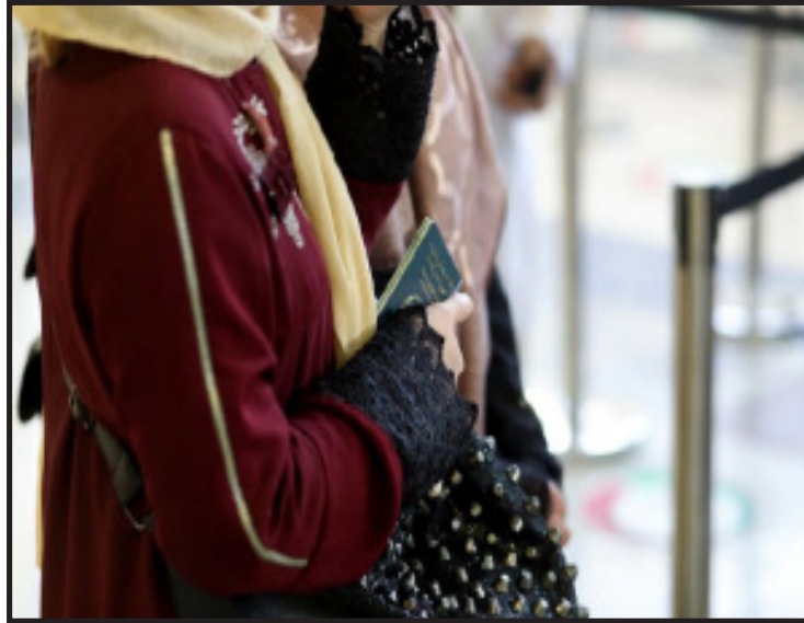
छलफल भएको थियो। त्यसपछि सो निर्णय लिइएको अधिकारीले बताएका हुन्। तालिबानीहरूले अमेरिकी पासपोर्ट भएकाहरूलाई समेत यात्रामा रोक लगाएको छ। तर मन्त्रालयले यो विषयमा आधिकारिक जानकारी दिएको छैन।

अफगानिस्तानमा तालिबानले महिलाहरूलाई एकलै हवाइजहाजमा यात्रा गर्न रोक लगाएको छ। सोमवार तालिबानले एकल यात्रा गर्ने महिलाहरूलाई उडानमा रोक लगाएको समाचार संस्था एएफपीले जनाएको छ। तालिबानले पुरुष आफन्तबिना एकलै यात्रा गर्ने सम्पूर्ण महिलालाई रोक अफगानिस्तानस्थित काबुल एयरलाइन्सलाई आदेश दिएको उड्डयन अधिकारीहरूले बताएका छन्। तालिबानीहरूले आइतबार नै एकलै यात्रा गरिरहेका महिलाहरूलाई बोर्डिङ पास दिन रोक आदेश दिएको अफगानिस्तान एरियाना अफगान एयरलाइन्स र काम एयरका दुई अधिकारीहरूले बताए। गत विहीवार तालिबानी प्रतिनिधि, दुई एयरलाइन्स र अध्यागमन अधिकारीहरूबिच