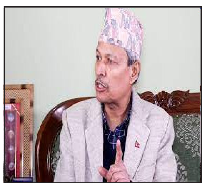
उत्तरदायी भएर काम गर्नुपर्ने पनि बताउनुभयो। यसैबीच राष्ट्रियसभा अन्तर्गतको राज्यका निर्देशक सिद्धान्त, नीति र दायित्वको कार्यान्वयन अनुगमन तथा मुल्यांकन समितिले पदावधि सकिएका तीन जना राष्ट्रियसभा सदस्यहरूलाई बिदाई गरेको छ।

काठमाडौं, ०१ चैत। नेकपा एमालेका नेता डा. भीम रावलले राष्ट्रियता सम्बन्धिका धेरै विषयहरूमा सांसदहरूमा नै एकरूपता हुन नसकेको बताउनुभयो। मंगलवार सिंहदरवारमा बसेको राज्यका निर्देशक सिद्धान्त, नीति र दायित्वको कार्यान्वयन अनुगमन तथा मुल्यांकन समितिको बैठकमा बोल्दै नेता रावलले राष्ट्रियता सम्बन्धिका धेरै विषयहरूमा सांसदहरूमा नै एकरूपता हुन नसकेको बताउनुभएको हो। उहाँले राष्ट्रियता सम्बन्धिका विषयमा सरकार र प्रधानमन्त्रीलाई घच्चच्याउन आवश्यक रहेको पनि बताउनुभयो। नेता रावलले प्रधानमन्त्रीलाई निर्देशित गर्ने समितिमा आजसम्म पनि प्रधानमन्त्री उपस्थित नहुनु दुःखद् भएको बताउनुभयो। उहाँले सबै नेतृत्वकर्ताहरूले देश र जनताप्रति