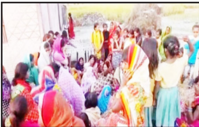
विरामीहरूको उपचार मोतीहारी अस्पतालमा भइरहेको छ । बेतियाका

एजेन्सी/वीरगञ्ज, ३० कार्तिक । बिहारका दुई जिल्ला गोपालगञ्ज र बेतियामा विषाक्त रक्सीबाट २४ जनाको ज्या न गएको छ । भारतीय पत्रिका दैनिक भास्करका अनुसार मृतकमध्ये १३ जना गोपालगञ्जका वासिन्दा थिए । यहाँ ७ जना गम्भीर विरामी छन् । यीमध्ये ३ जनाको आँखाको दृष्टि गुमेको छ । यस्तै बेतियामा १० जनाको मृत्यु भएको छ । यहाँ ७ जनाको अवस्था गम्भीर छ । यी सबैले विषाक्त रक्सी पिएको आशंका गरिएको छ । गोपालगञ्जका